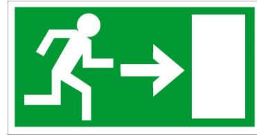
Fluchtweg nach rechts