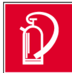
Kennzeichnung für Feuerlöscher